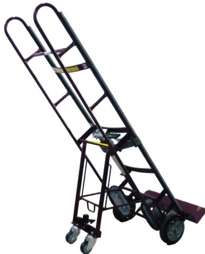
Figure 2 – Support en position complètement verrouillée