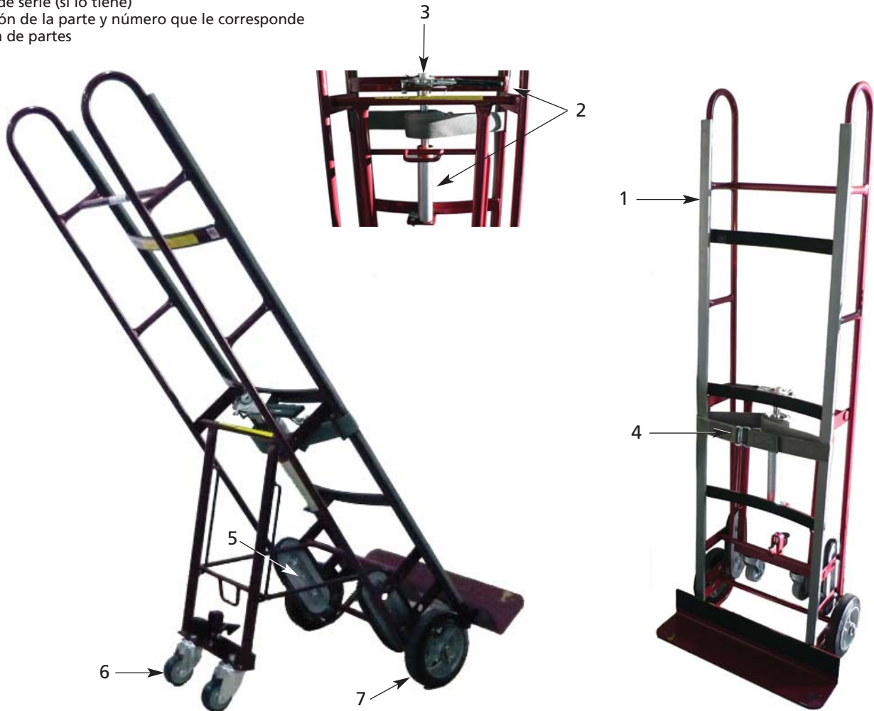
Figura 3 – Ilustración de las Partes de Reparación para las Carretillas Portadoras de Máquinas Expendedoras