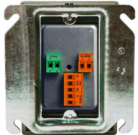
12-Series Vista Trasera