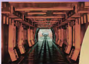
Resistencia a altas temperaturas de trabajo hasta 300 ° F