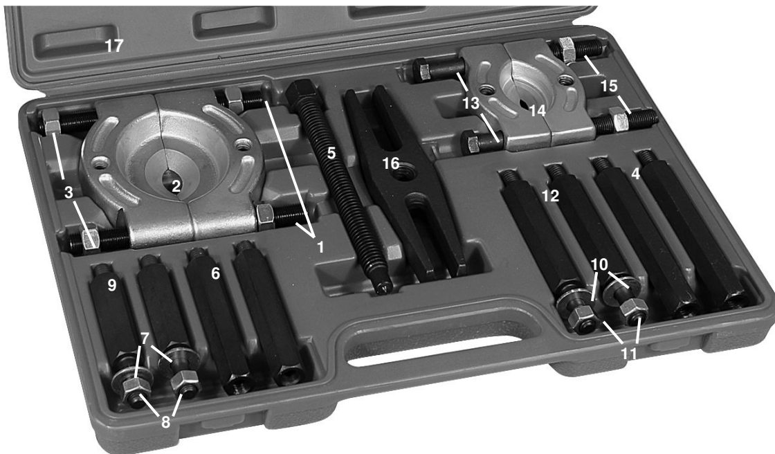
Figure A – Repair Parts Illustration for Model(s) 23NY36